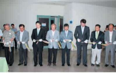
'건축문화축제' 개막을 알리는 테이프 커팅식