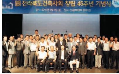
전북건축사회 창립 45주년 기념식