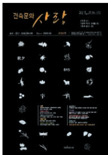
표 / 지 / 설 / 명 애아 가을을 그려보자 무엇을 그릴까? 이제 초등학교에 갓 입학한 1학년 아들이 나에게 물었다 색깔은 주황색, 갈색 나뭇잎은 단풍나무, 은행잎, 갈나무잎 과일은 감, 밤, 배, 사과, 대추 꽃은 코스모스, 국화 동물은 다람쥐, 잠자리, 쥐 밭하늘에는 달, 황금색 털을 가진 양자리 숫자는 815 그리고 秋夕, 月, 宇, 宙 어린이 동심은 한 폭의 수채화입니다 우리의 가을이 이웃과 더불어 더욱 풍요롭기를 기도드립니다

발행처 광주광역시건축사회 발행인 신정철 전남회장 김강수 전북회장 이성엽 편집인 박홍근 전담기자 박승국 편집위원 이순미, 서재형, 정태호, 신영은, 박신남, 정명환, 장성호, 송명옥, 김기범, 정영범, 정관성, 박종호 등록번호 광주광역시 라00144 간 별 월간 등록일자 2010-01-25 인쇄·제작 삼화문화사 T.062)222-6660 광고신청 T.062)521-0025