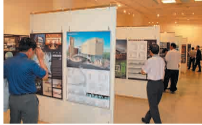
많은 사람들의 주목을 받은 국제교류 전시회